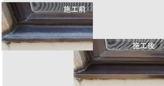
水切面台の復元 コートスーパー