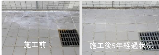
床タイルの脱色 コートスーパー

固絞りウェスで塗り伸ばし 厚塗り厳禁 ※サッシ、パネルにご使用の場合は塗布後に 乾拭きウェスで拭き取って下さい