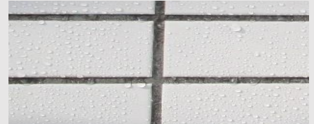
タイル・目地の撥水 コートクリア